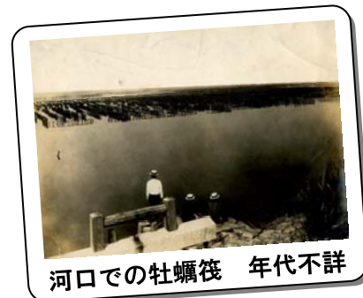
河口での牡蠣筏 年代不詳